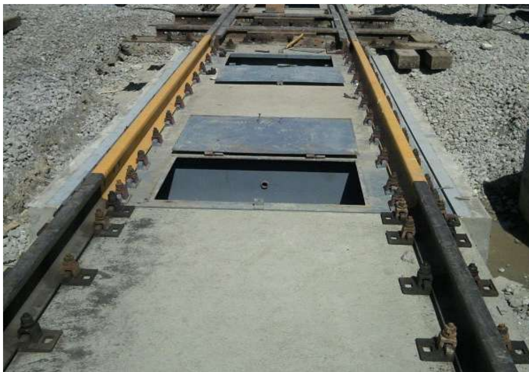
Рисунок 2 – Общий вид ГПУ весов