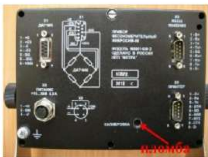
M0601 Пломба для нанесения знака поверки