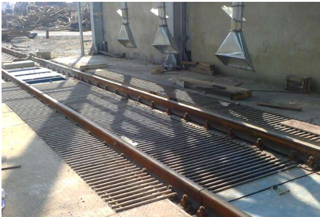
Рисунок 1 – Общий вид весов