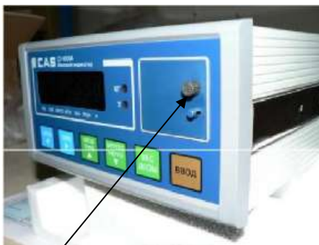
Место пломбирования для нанесения знака поверки CI-6000A

Защита от несанкционированного доступа к настройкам и данным измерений обеспечивается защитными пломбами (или наклейками) с нанесенными знаками поверки как показано на рисунках 4 и 5.