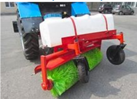
Щетка коммунальная с увлажнением (ТМК-УЩ-люкс)

Навесное щетоное оборудование, предназначенное для очистки площадей, придомовых и производственных территорий, городских дорог. В комплекте идет бак с водой (300л) и система увлажнения очищаемой поверхности.