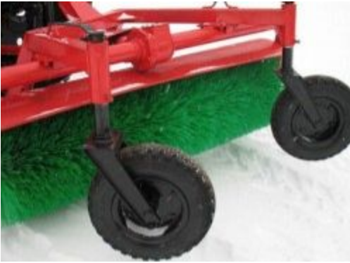
Щетка коммунальная (ТМК-КЩ-1,3/320)