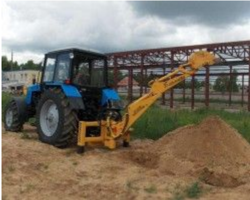
Мини экскаватор (ТМК-МЭ-0,4/80)

навесная установка для тракторов Беларус тягового класса 1.4 и выше