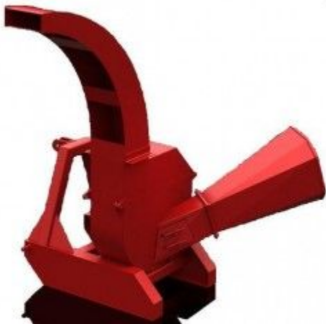
Рубильная машина (ТМК-ИМ-160)