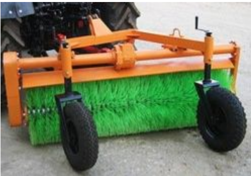
Щетка коммунальная (ТМК-КЩ-1,8/80)