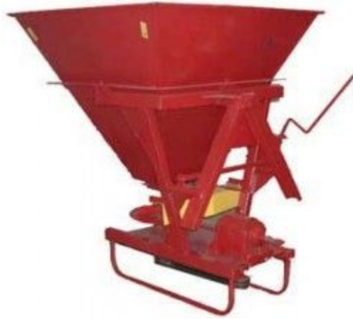
Разбрасыватель песка (ТМК-Л-116)

Россия, 143900, М.О. г.Балашиха, пр-т Ленина, 25 тел./факс: (495)585-51-00, 585-51-01