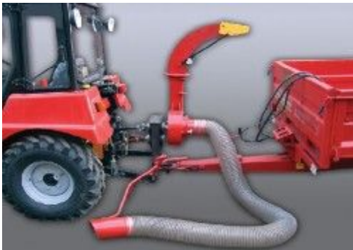
Пылесос парковый навесной(ТМК- ППН/320)