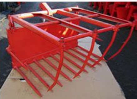
Вилы сельскохозяйственные с прижимом