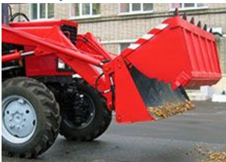
Ковш двухчелюстной (ТМК-КНД-0,6/80)