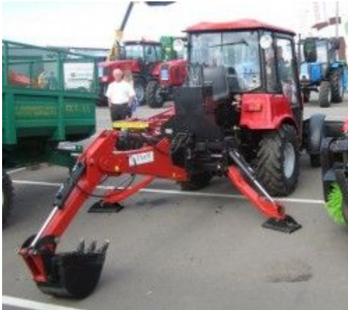
Мини экскаватор (ТМК-МЭ-0,3/320)