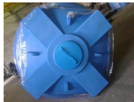
Ёмкость А 5000