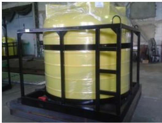
Емкость «Кассета 5000x1 S»