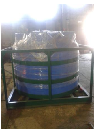
Емкость «Кассета 5000x1 S2»