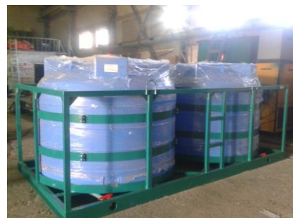
Емкость «Кассета 5000x2 S2»