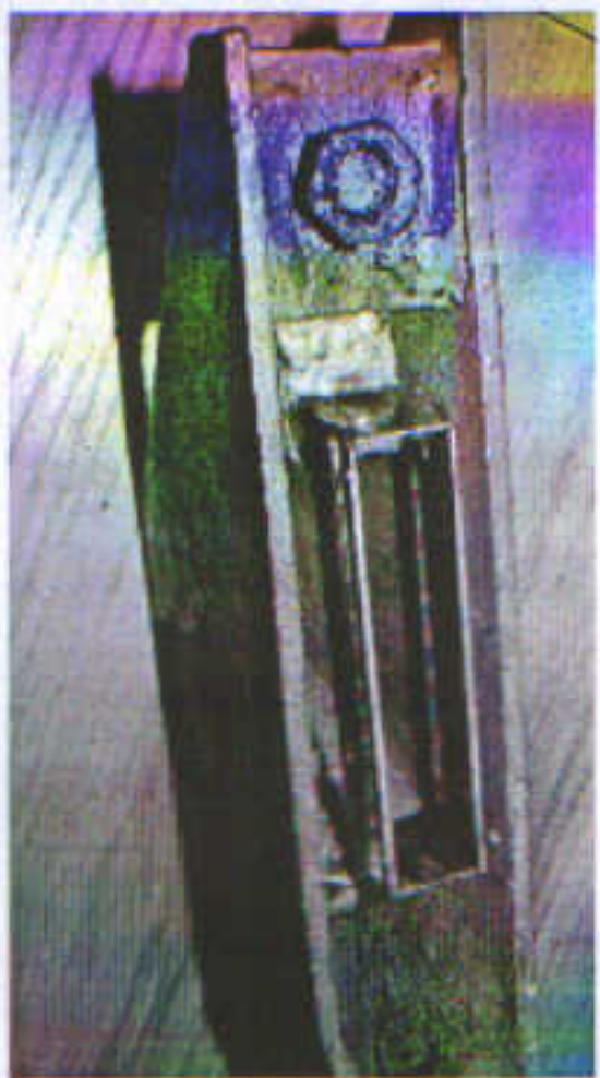
Кронштейн крепления (ШП) установленный рядом ягути.