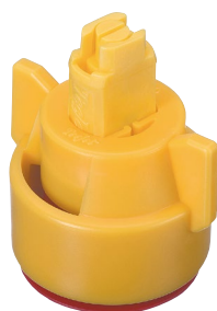
РАСПЫЛИТЕЛЬ AIXR И КОЛПАЧОК