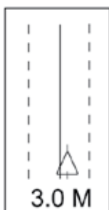
Страница навигационной карты