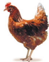
ГРАФИК ПРОДУКТИВНОСТИ КОРИЧНЕВОЙ НЕСУШКИ