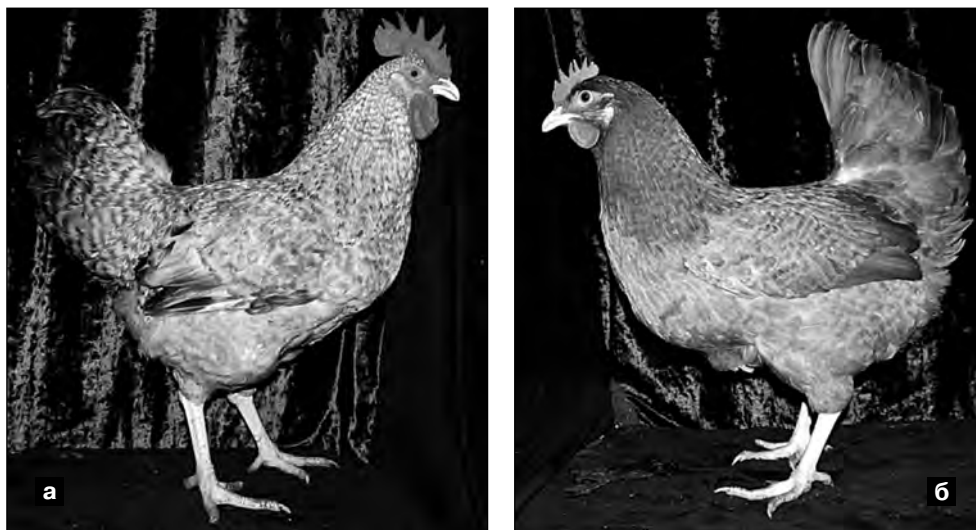
Фото 3. а — Темно-полосатый петух и б — полосатая курица популяции Опытная-ЦС

В результате проведенного опыта получено 112 цыплят, которых разделили на более светлых