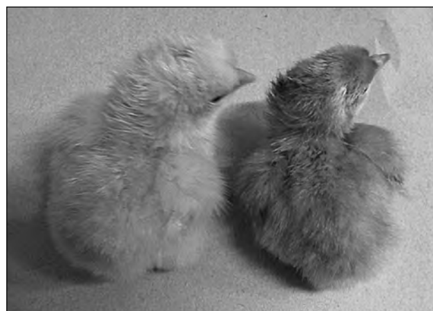
Фото 4. Желтый петушок (слева) и палевая курочка (справа) популяции Опытная—ЦС

Опытные популяции коллекционера «Генофонд» ВНИИГРЖ имеют высокие (для комбинированных пород) продуктивные качества и пользуются спросом в приусадебных хозяйствах Ленинградской области и других регионов России. Яйценоскость кур популяции Опытная-1 за 52 недели жизни — 110–115 яиц (в среднем на уровне 61–64% кладки).