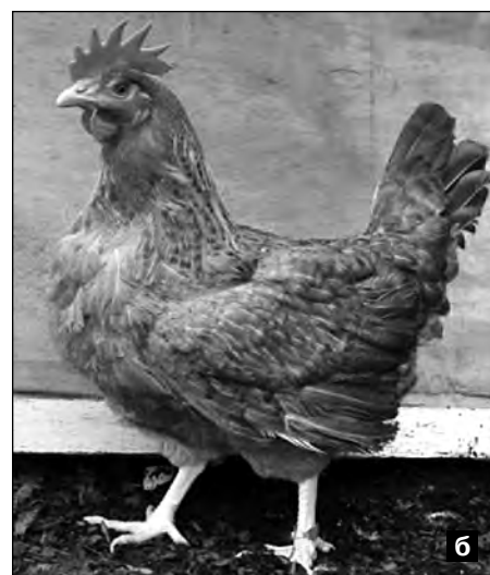
Фото 1. Окраска взрослого оперения птицы популяции Опытная-1: а — петух, б — курица