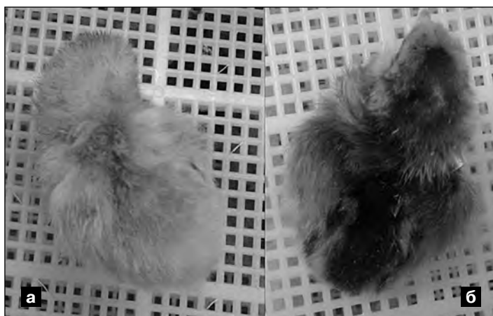
Фото 2. Цыплята популяции Опытная-1: а — петушок, б — курочка

На фото 2 представлены цыплята популяции Опытная-1, отобранные от родителей, имеющих яркие фенотипические признаки половой принадлежности в суточном возрасте: курочка более темной окраски имеет черные продольные полосы на спине, характерные для дикой окраски; у петушка светло-палевая окраска пуха.