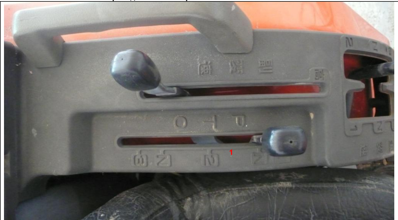
1 Коробка скоростей ВОМ