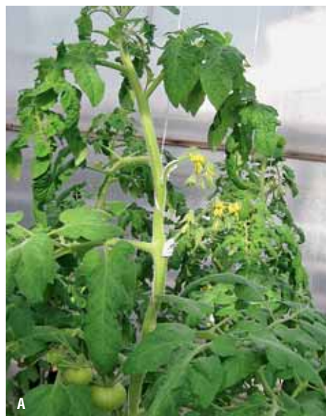
Рис. 1. Генеративный (А) и вегетативный (Б) тип развития растений томата

• Повышение концентрации CO 2 в воздухе. В листьях при этом возрастает интенсивность фотосинтеза, что способствует лучшему завязыванию плодов, увеличению их числа в соцветии. Одновременно увеличивается средняя масса плода, что, в свою очередь, повышает нагрузку растения плодами, т.е. стимулирует процессы генеративного развития.