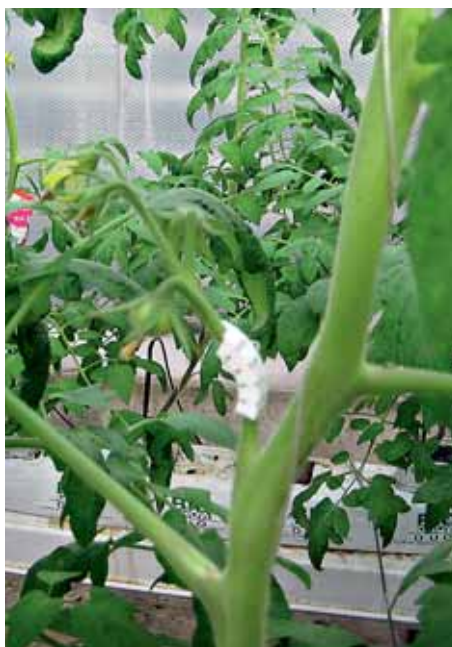
Рис. 2. Применение кистедержателя

• Повышение относительной влажности воздуха до 75-80% и уменьшение вентиляции теплицы. Влажность воздуха в теплице в первую очередь