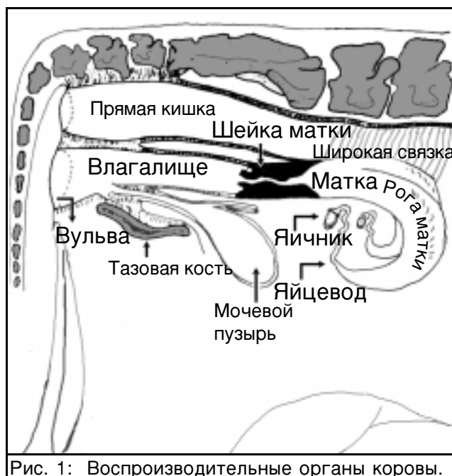
Рис. 1: Воспроизводительные органы коровы.

Матка является той частью воспроизводительного тракта, где вынашивается развивающийся теленок. У небеременной коровы матка не превышает пяти сантиметров в длину и имеет левый и правый рога, загибающиеся наподобие рогов барана (Рис.1). Матка представляет собой мускульный орган, обладающий огромной способностью к расширению, позволяющей ей вмещать растущего теленка. К концу беременности в матке помещается теленок весом 35-40 кг, от 20 до 40 кг жидкости и пять килограммов ткани плаценты (послед). Матке и другим частям воспроизводительного тракта требуется около 40 дней для восстановления их первоначального размера (процесс, называемый инволюцией).