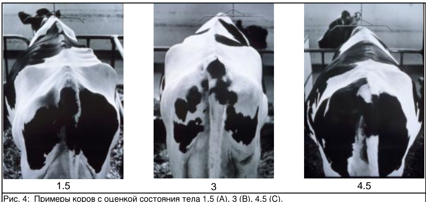
Рис. 4: Примеры коров с оценкой состояния тела 1,5 (А), 3 (В), 4,5 (С).

Такая оценка состояния тела обеспечивает корове достаточное количество резервов организма для максимального снижения риска возникновения осложнений при отеле при наибольшем увеличении молочной продуктивности в ранней лактации. По мере снижения продуктивности в поздней лактации корова быстро набирает вес. Перекармливание концентратами при этом является типичной ошибкой. Коровы, потребившие слишком много концентратов на последней стадии лактации, склонны к ожирению (Рис.4с). У таких коров более вероятны осложнения при отеле и развитие других расстройств (синдром жирной